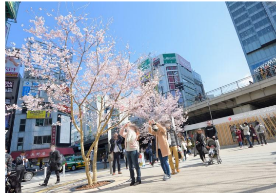
*会場近くの新宿駅東南口広場にある タカトコヒガンザクラの開花時期に合わせて開催