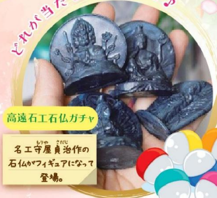
高遠石工石仏ガチャ