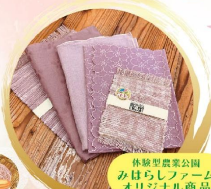
体験型農業公園 みはらしファーム オリジナル商品