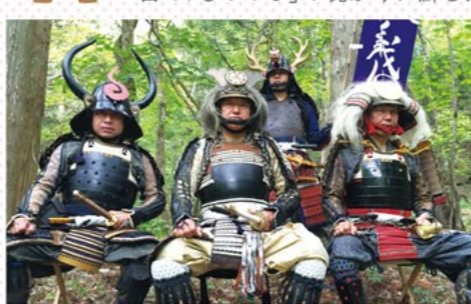
Samurai Dance Performance 武士道演舞 13:00~ / 15:00~ / 17:00~